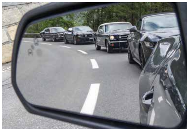
Päiväretkillä kotimaassa sekä naapurivaltioissa.