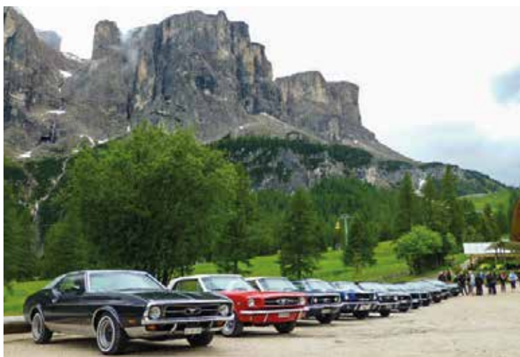
Sveitsin kerhon jäsenyys edellyttää Mustangin omistamista.