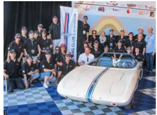
Mustangin 55-vuotisjuhlassa Charlottessa vuonna 2019, sekä osallistuimme Mustang-museon avajaisiin.

bielämä, johon kuuluvat myös päiväretket kotimaassa ja ulkomailla. Normaalia toimintaa ajokaudella (huhti-syyskuu) ovat alueelliset viikoittaiset tapaamiset, joissa keskustellaan yhteiseen harrastukseen liittyvistä asioista.