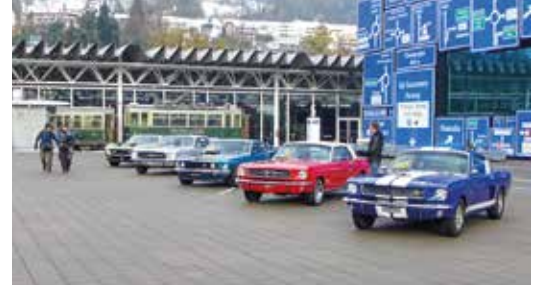
CBS US-TV:n vieraana Amazing Race -ohjelmassa 2014.