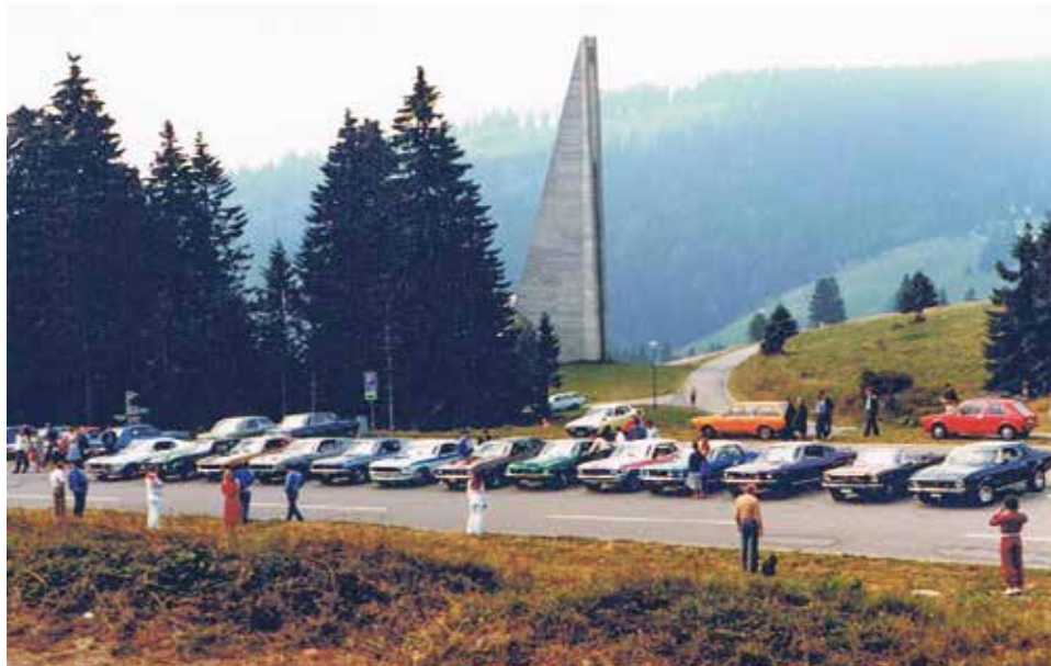
Kuva Mustang-kokouksesta kerhon perustamisen ajoilta.