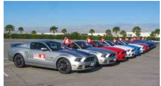
Mustangin 50-vuotisjuhlassa Las Vegasissa 2014.